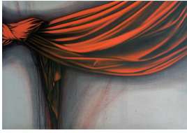
(3)「untitled」 油彩・キャンバス、2010

れる緞帳のごとくある (3) 。奥行きのある色彩を得たいと考えて学んだ古典技法は佐藤に、複数の層の重なりによって油彩画がかたちづくられるということをはっきりと知らせた。ひとつひとつの層は完成のための作業の工程を意味する。それを重ねていくことで、彼女の“描く時間”は絵画の構造そのものとして提示されるようになった。