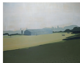
(2)「物語のある風景」 油彩・キャンバス、2004